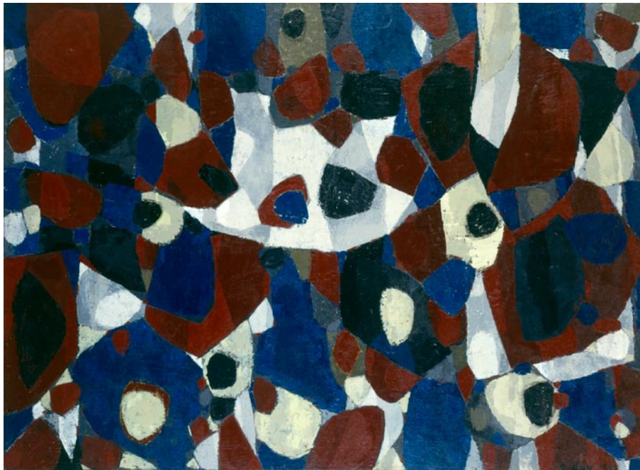
Tohu Va Bohu . Huile et résine, 1955 Collection Maeght, Paris