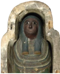
Cercueil d'Ousirmes, momie. Fin de la 25 e dynastie