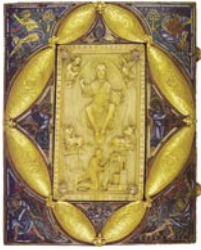
Évangélaire de Notger, manuscrit du X e siècle.