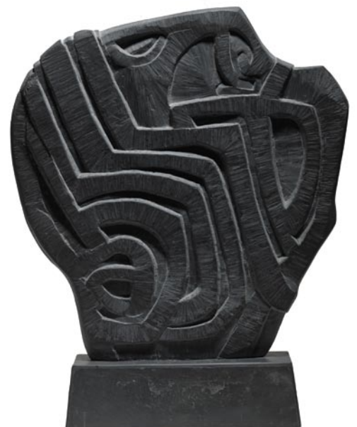
Tête dressée , 1976-78. Ardoise taillée double face Collection Hôtel Bedford, Paris

Dans les années 60, ses peintures, sur panneaux recouverts de résines amalgamées, réalisent une synthèse et un