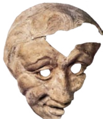
Masque de Bonsin, Terre cuite blanche, époque romaine.

Depuis l'ouverture le 6 mars 2009, plus de 100 000 visiteurs ont apprécié les riches collections et le patrimoine architectural du Grand Curtius.