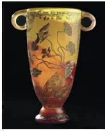
Vase Canthare, Emile Gallé, Nancy, 1800-1895.