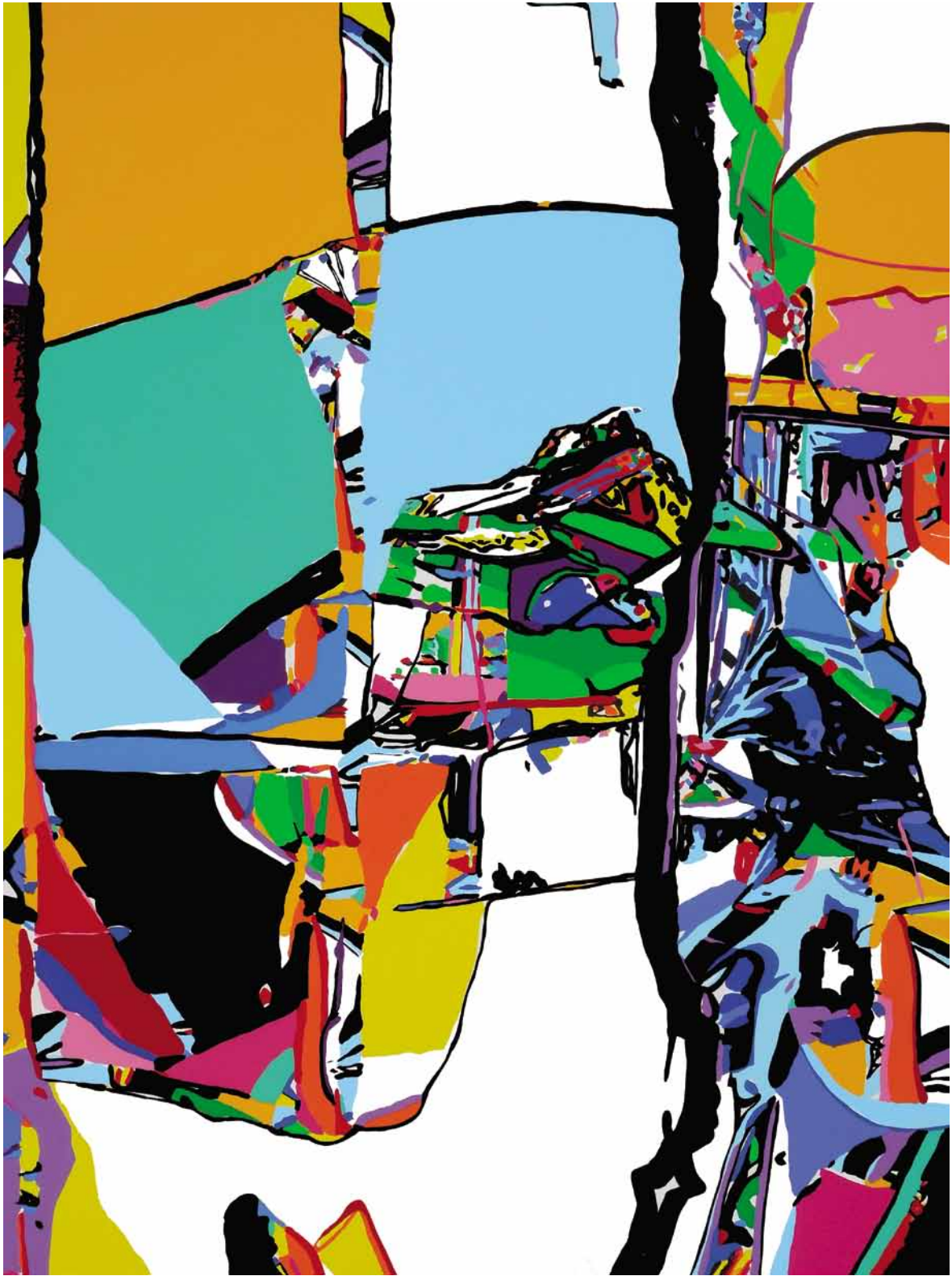
Luis Salazar, Acrylique sur toile, 200 x 150.