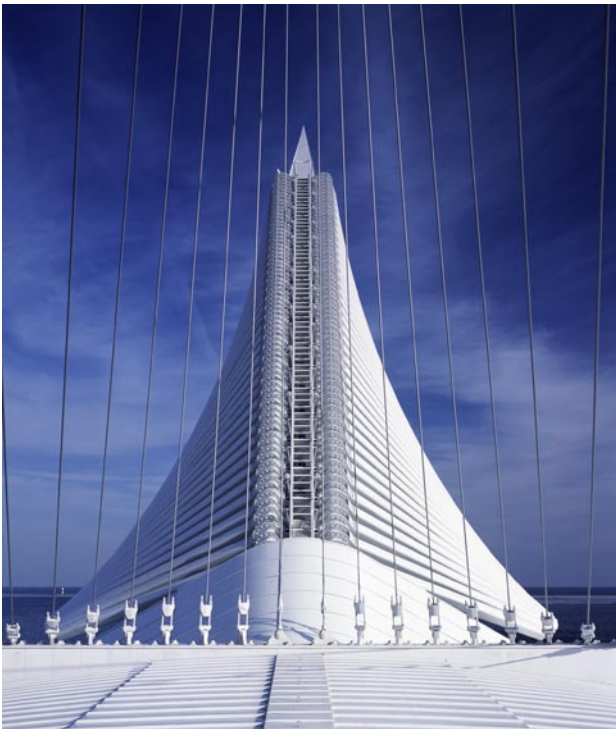
Milwaukee © Santiago Calatrava, architect and engineer

Un dossier pédagogique à destination du public scolaire est également édité.