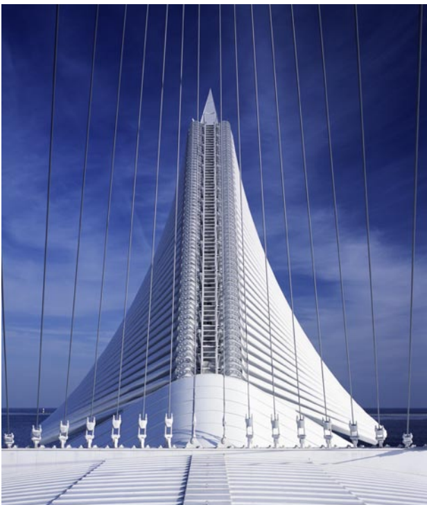
Milwaukee

Eine Dokumentation für Schüler und Lehrer wird ebenfalls herausgegeben.