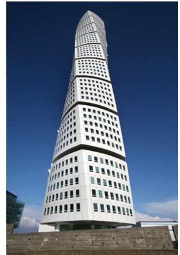
Gratte-ciel Turning Torso Malmö (Suède, 1999-05) © Santiago Calatrava, architect and engineer