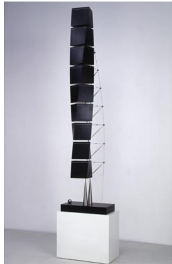
Twisting Torso, 2002, Sculpture en ébène © Santiago Calatrava, architect and engineer